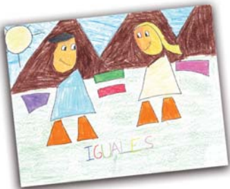
Primer finalista Realizado por: JULIANNE NISSI VALDEZ GONZALO CARRASCAL CEIP Vicente Aleixandre. Las Rozas (4º)