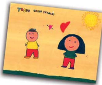
Segundo finalista Realizado por: RENÉ LÓPEZ GONZALO ARIAS CEIP El Cantizal. Las Rozas (4º)