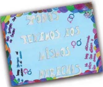
Tercer finalista Realizado por: MACARENA SÁNCHEZ ELENA GÓMEZ LOURDES SÁNCHEZ CEIP San Miguel. Las Rozas (4º)